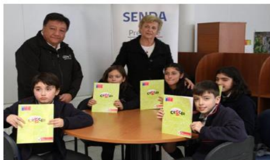
Se trata de los colegios Santa María de Las Condes, Juan Pablo II y Leonardo da Vinci.

Tres colegios municipales de Las Condes recibieron la certificación entregada por el Servicio Nacional para la Prevención y Rehabilitación del Consumo de Drogas y Alcohol (Senda) y el Ministerio de Educación por su aplicación del programa de Prevención de Drogas.