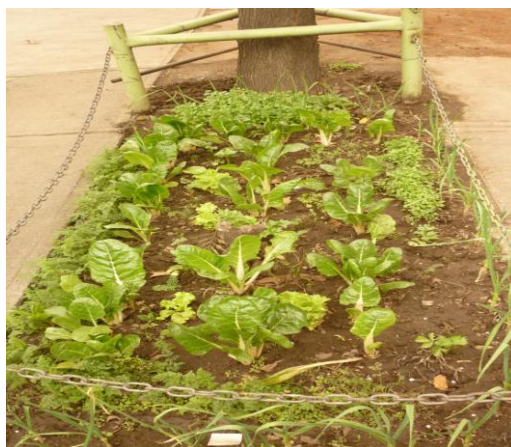
Foto del Huerto inserto en la JV C-14