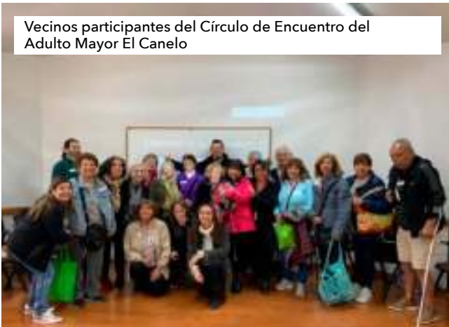
Vecinos participantes del Círculo de Encuentro del Adulto Mayor El Canelo