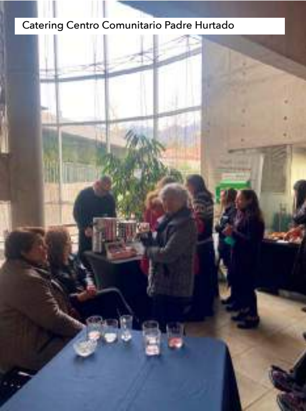
Catering Centro Comunitario Padre Hurtado