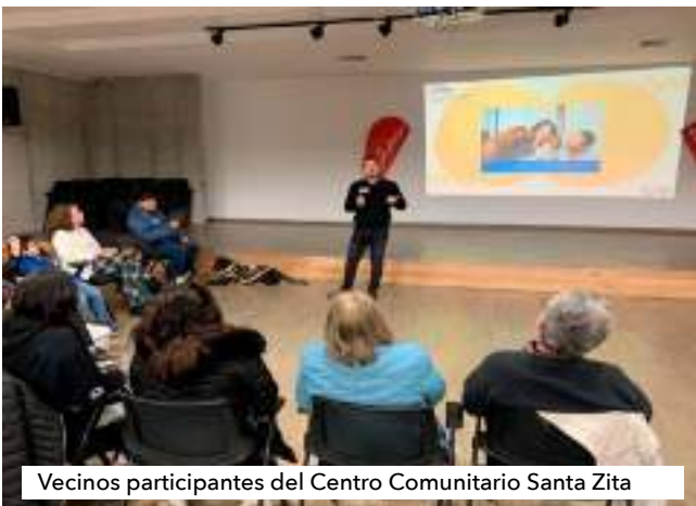
Vecinos participantes del Centro Comunitario Santa Zita