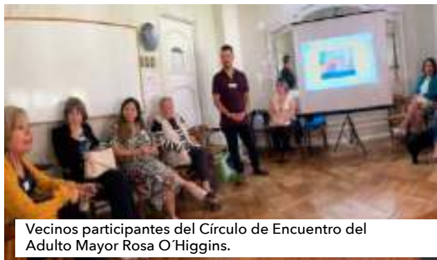
Vecinos participantes del Círculo de Encuentro del Adulto Mayor Rosa O'Higgins.