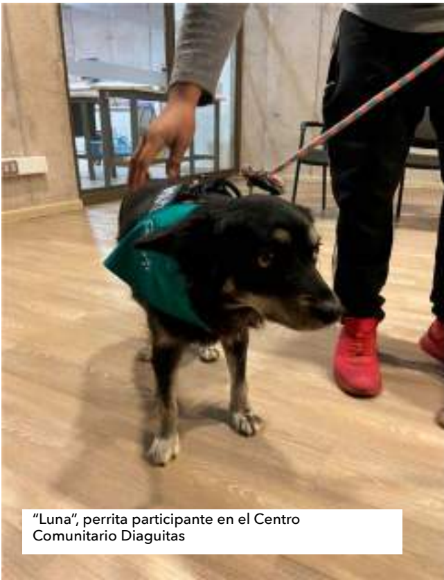
"Luna", perrita participante en el Centro Comunitario Diaguitas