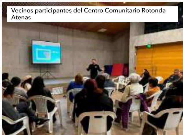
Vecinos participantes del Centro Comunitario Rotonda Atenas