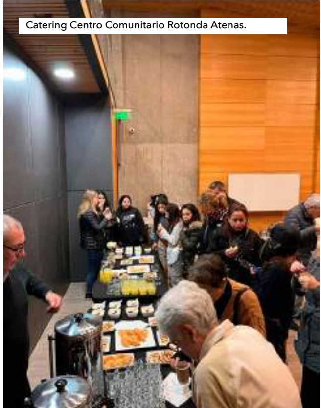
Catering Centro Comunitario Rotonda Atenas.