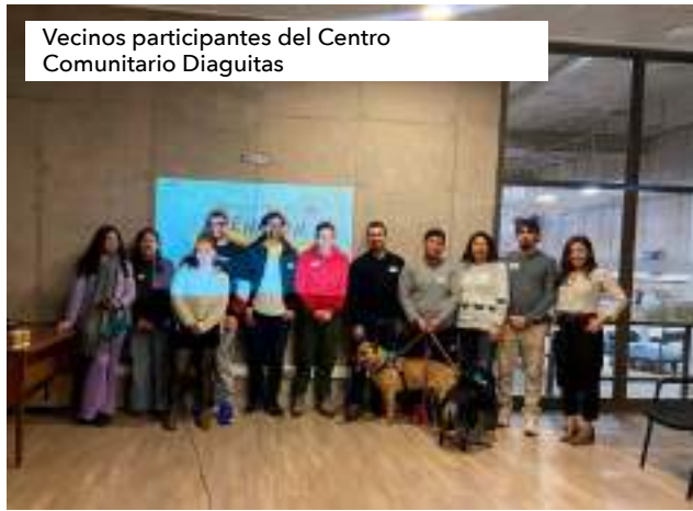
Vecinos participantes del Centro Comunitario Diaguitas