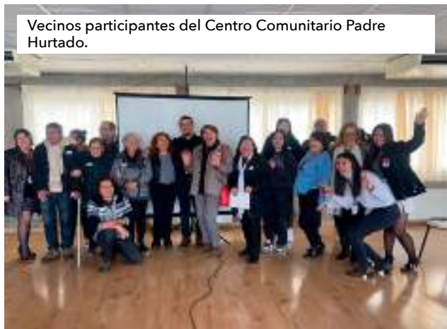
Vecinos participantes del Centro Comunitario Padre Hurtado.